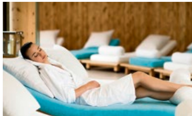
Auch die Schönheitspflege kommt nicht zu kurz.

TANNHEIM. Im alpinen Lifestyle-Hotel Jungbrunn im Tirol gehen Wintersport, Kulinarik und Wellness Hand in Hand.