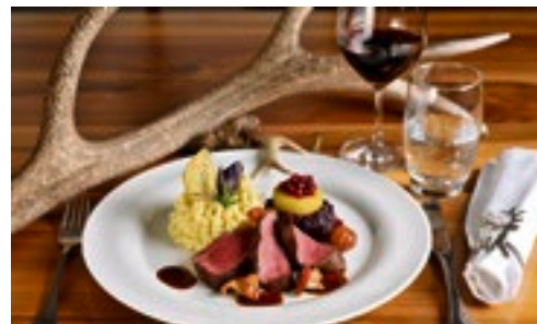
Traditionsküche modern verpackt.