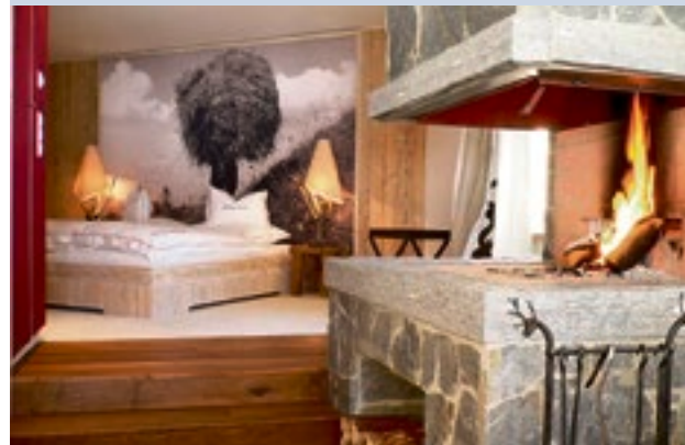
Die Suite «Bergfeuer» versprüht heimelige Atmosphäre.