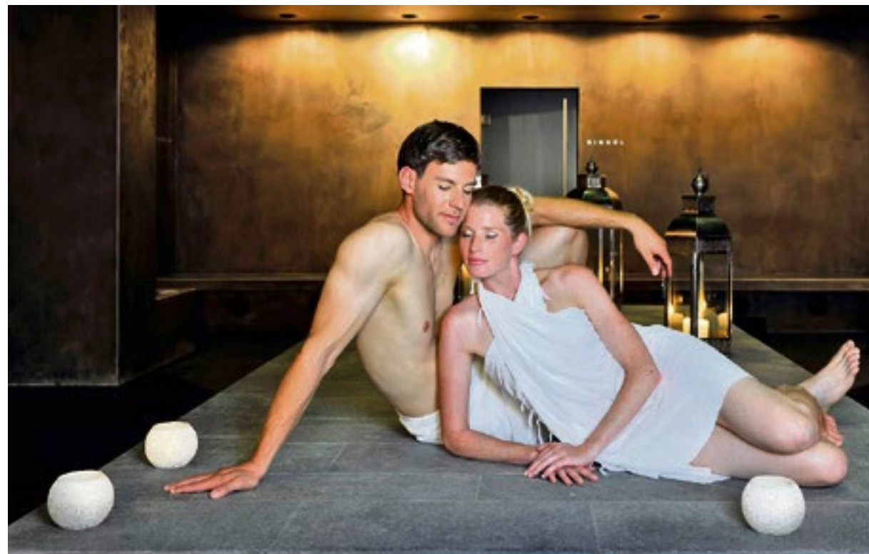
Entspannen in sinnlicher Atmosphäre.