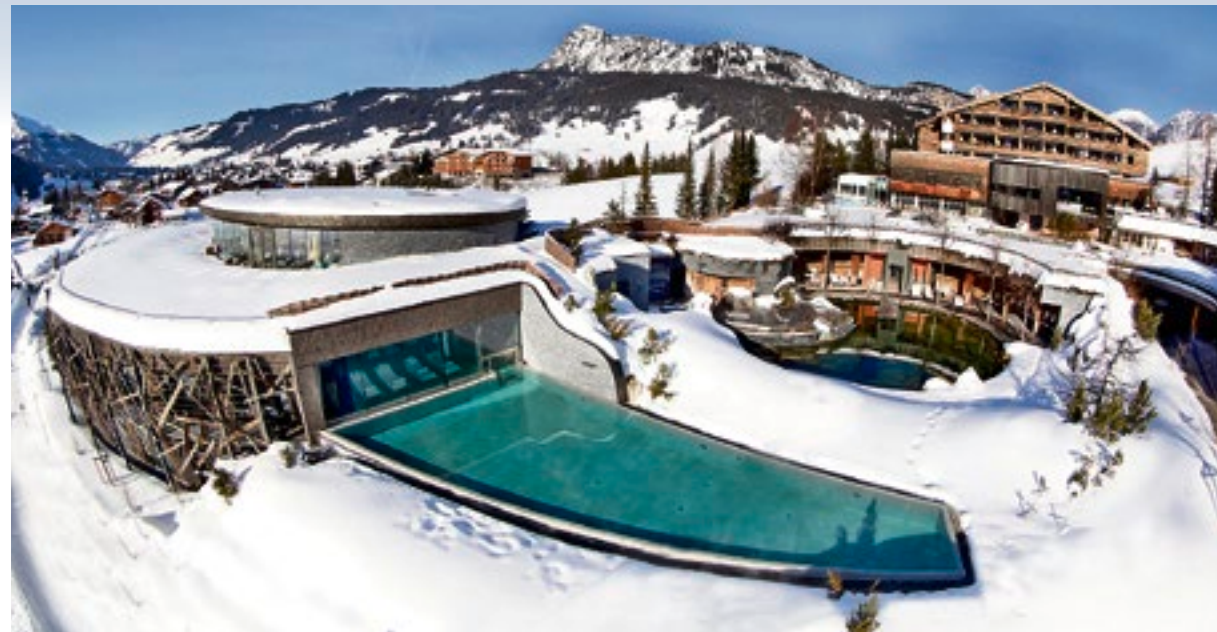
Bei Minustemperaturen entspannen:

Wer sich richtig auspowern will, der kann das im Fitness-