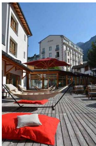
Reiseziel Lenzerheide: Viel Genuss im Familienhotel Schweizerhof in Graubünden

Und dann sind da noch im Schweizerhof die Forscherwochen. Biologen und Chemiker zeigen jeweils über eine Ferienwoche