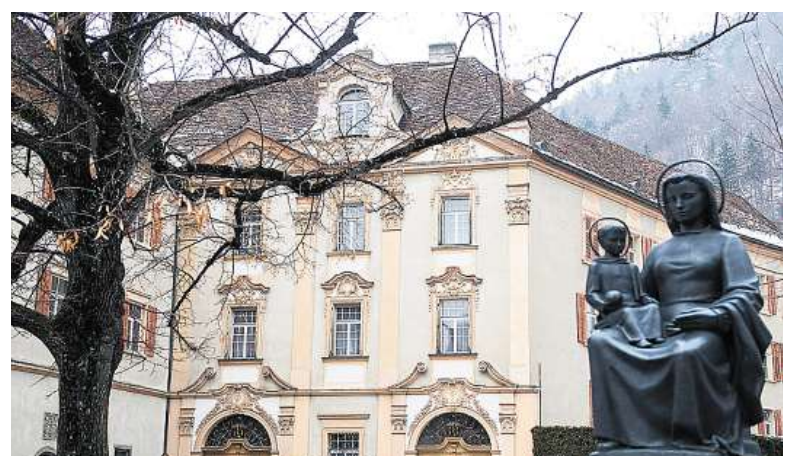
Die Schweizer Bischofskonferenz und Bischof Vitus Huonder wollen sich mit ihren Gegnern treffen, wie es beim Bistum Chur heisst.