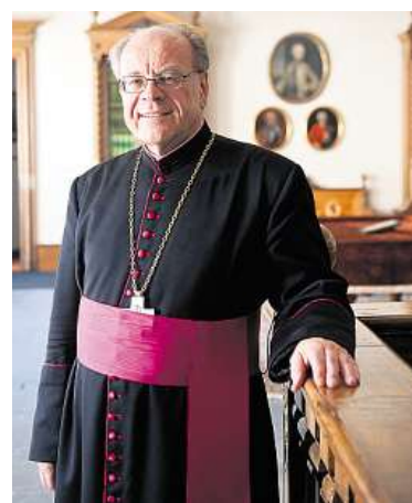
Bischof Vitus Huonder sucht den Dialog.

tik und die Forderungen der Protestierenden betreffen nicht einzelne Personalfragen», so Gracia. Hier gehe es um tiefere, globale Glaubensfragen, welche die Weltkirche be-