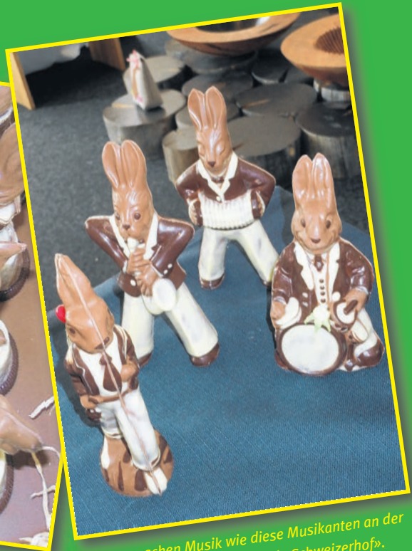
Oder sie machen Musik wie diese Musikanten an der Osterhasenausstellung im Hotel «Schweizerhof».