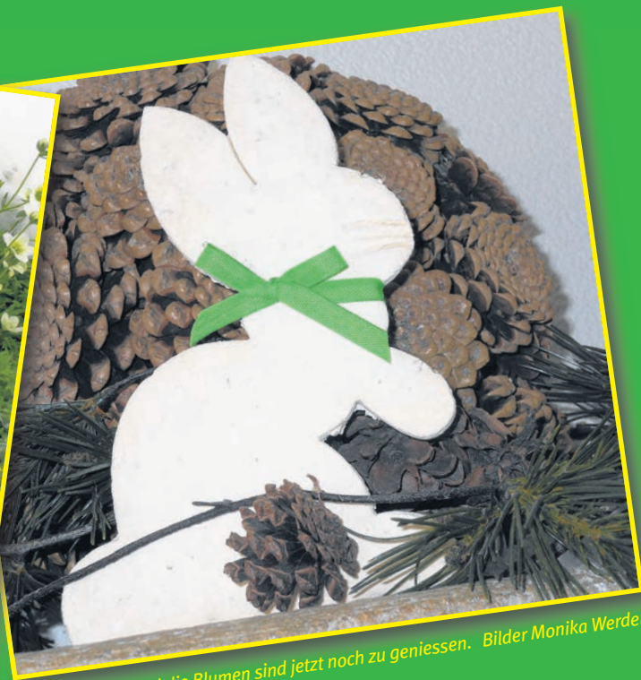
... und die Eier und die Blumen sind jetzt noch zu geniessen.