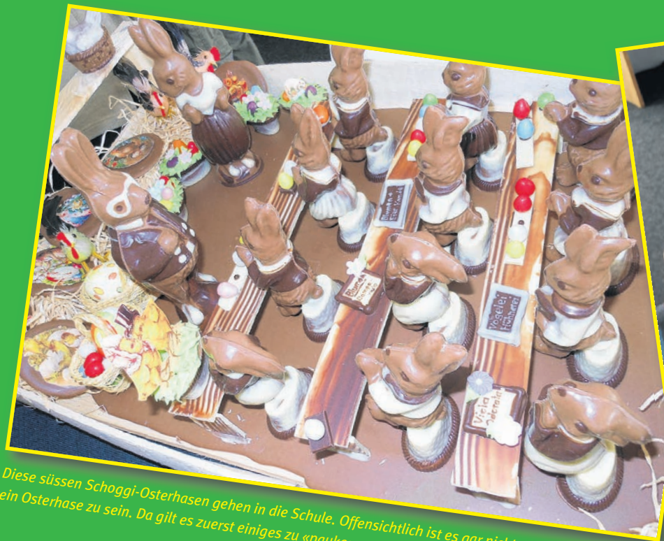
Diese süssen Schoggi-Osterhasen gehen in die Schule. Offensichtlich ist es gar nicht so leicht, ein Osterhase zu sein. Da gilt es zuerst einiges zu «pauken».